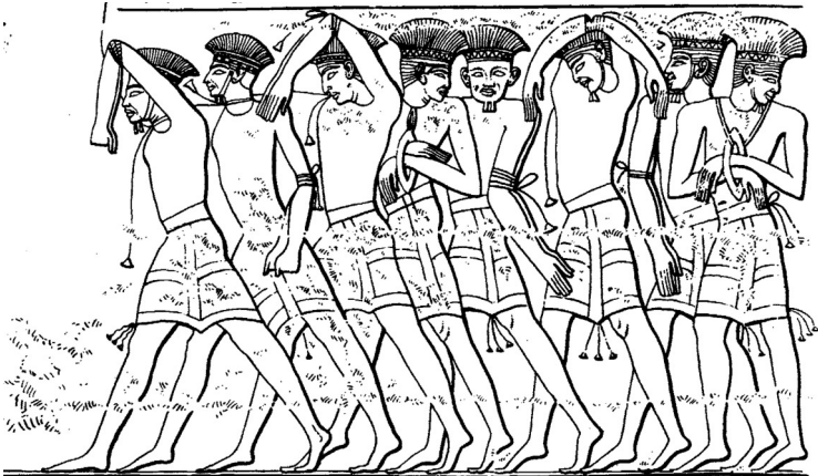
Afb. 1. Als gevangenen afgebeelde mensen van de Zeevolken in Medinet Haboe (uit Medinet Habu, deel 1, pl. 44; met dank aan het Oriental Institute van de universiteit van Chicago).

Volgens de inscripties van Ramses was geen enkel land in staat weerstand te bieden aan deze stortvloed van mensen. Verzet was zinloos. De grote machten in die dagen – de Hittieten, Myceners, Ka-